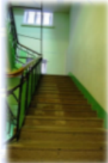
По лестнице на 3й этаж