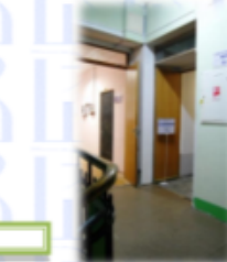
ЮЛЕВО и по коридору ПРЖЕМО