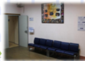
И снова ЮЛЕВО