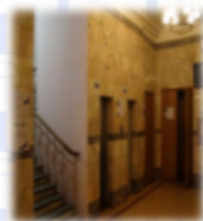
ЮЛЕВО на ВТОРОЙ этаж