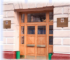
Центральный вход МЯСНОПРКАЯ 20